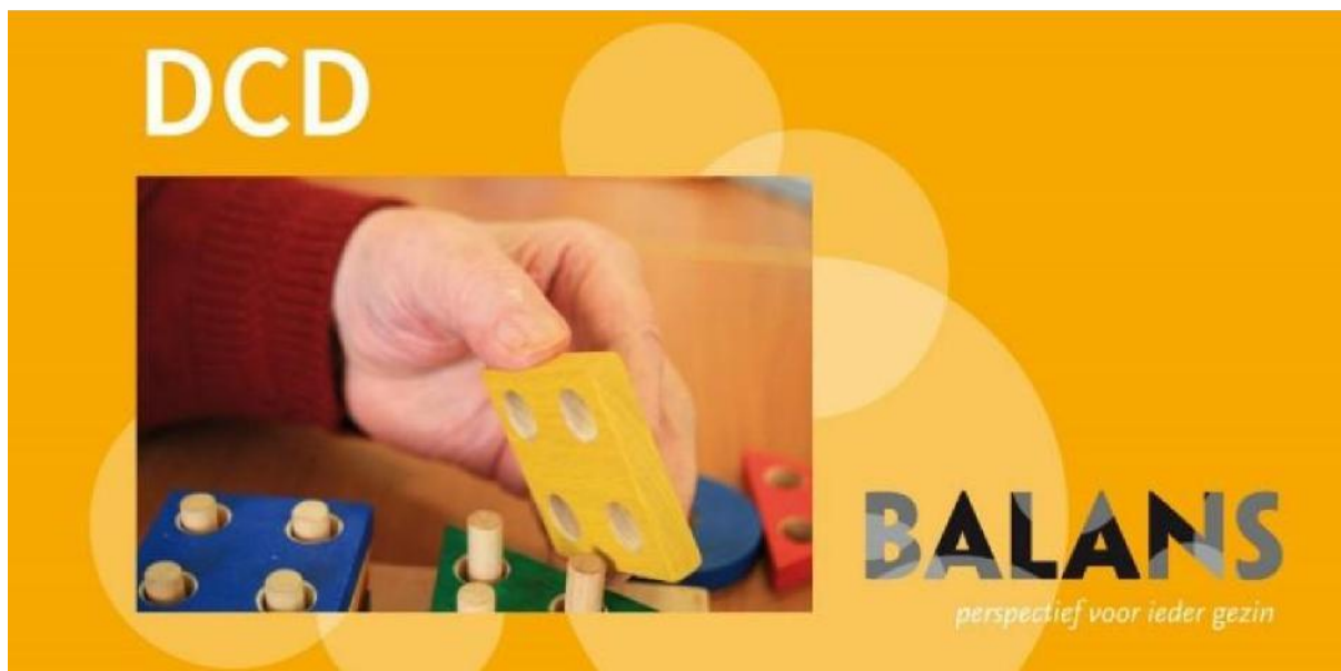
Familiedag DCD 2024

In 2023 zijn in totaal 70 nieuwe aanvragen in behandeling genomen. Daarvan zijn 64 aanvragen gehonoreerd en 6 aanvragen afgewezen.