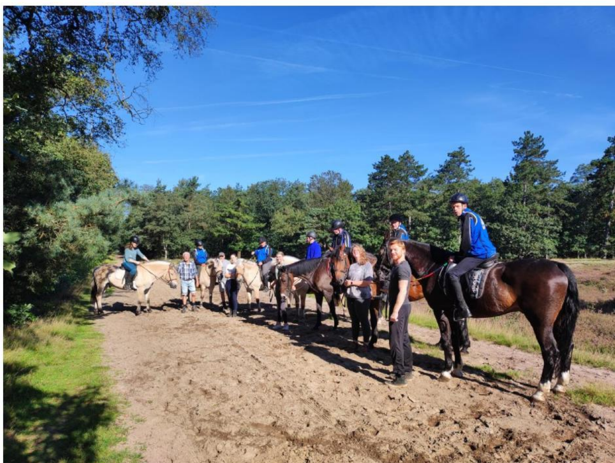
VPG Opmeer ruiterkamp 2023